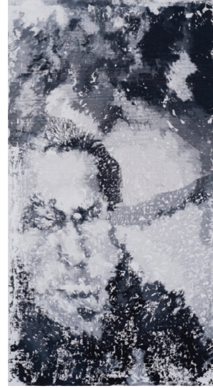
Concerta (2017), Tuval üzerine yağlıboya / Oil on canvas, 7 parça/pieces, 70 x 30 cm (her biri/each)