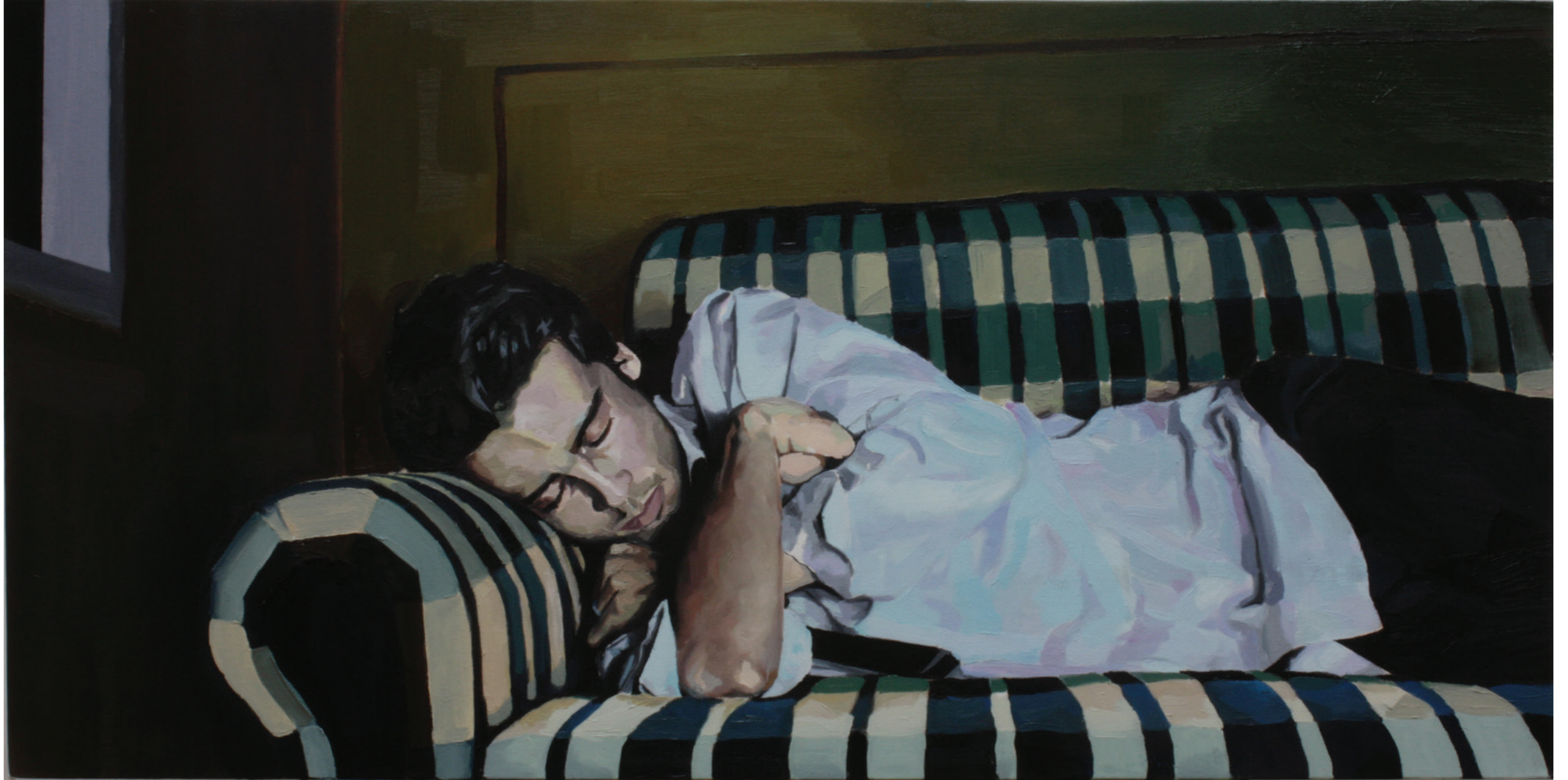
Uyuyan Çocuk (2009) Sleeping Boy (2009) Tıval ¼zerine yađlıboya Oil on canvas 40 x 80 cm