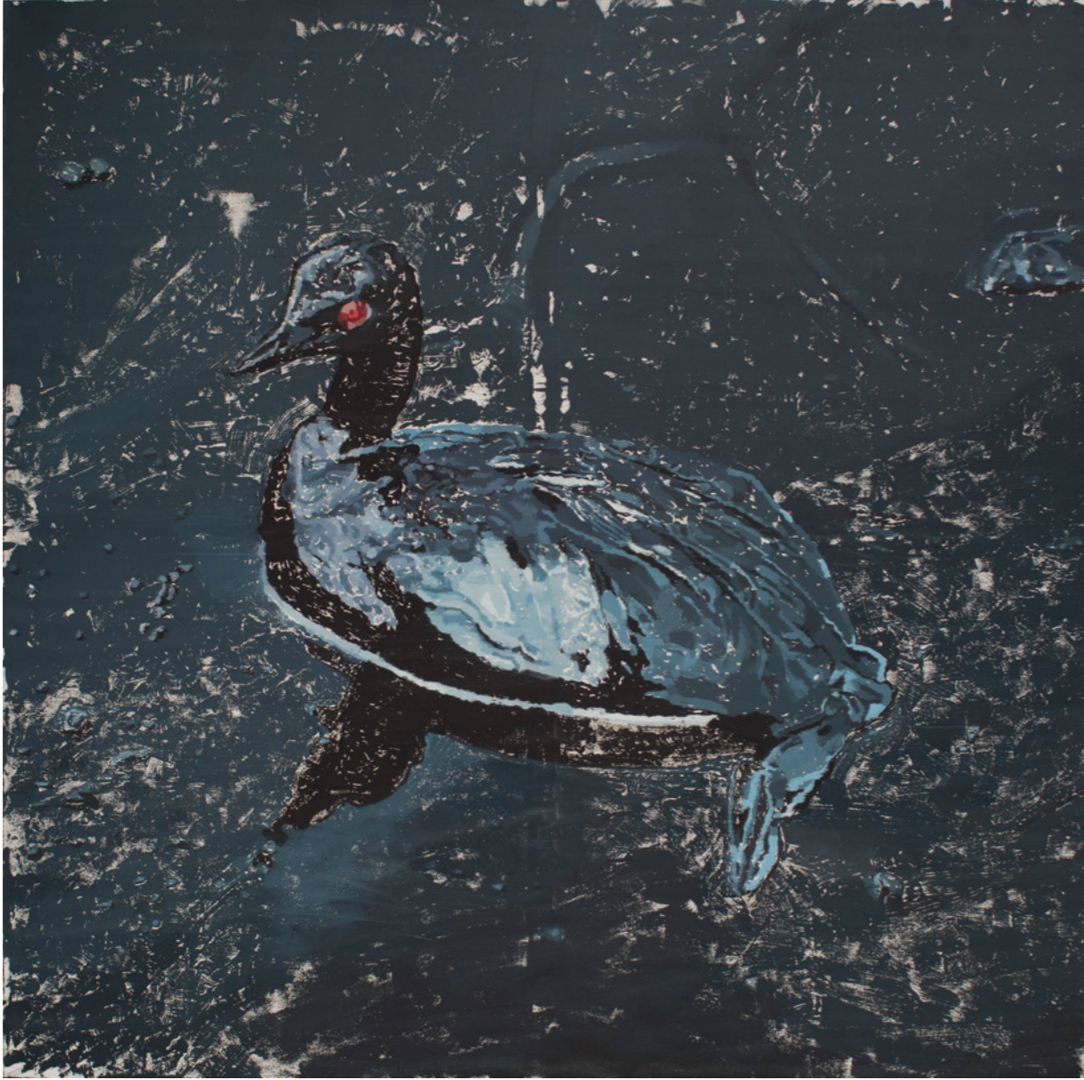
Ritalin (2017), Tuval üzerine yağlıboya / Oil on canvas, 175 x 175 cm