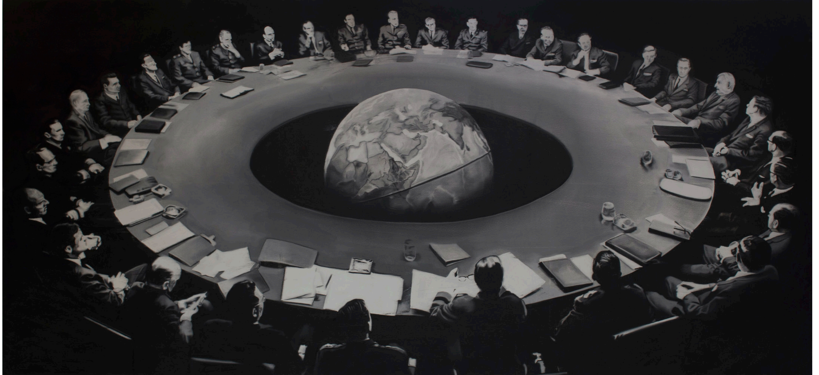
Zopiklon (2017), Tuval üzerine yağlıboya / Oil on canvas, 140 x 300 cm