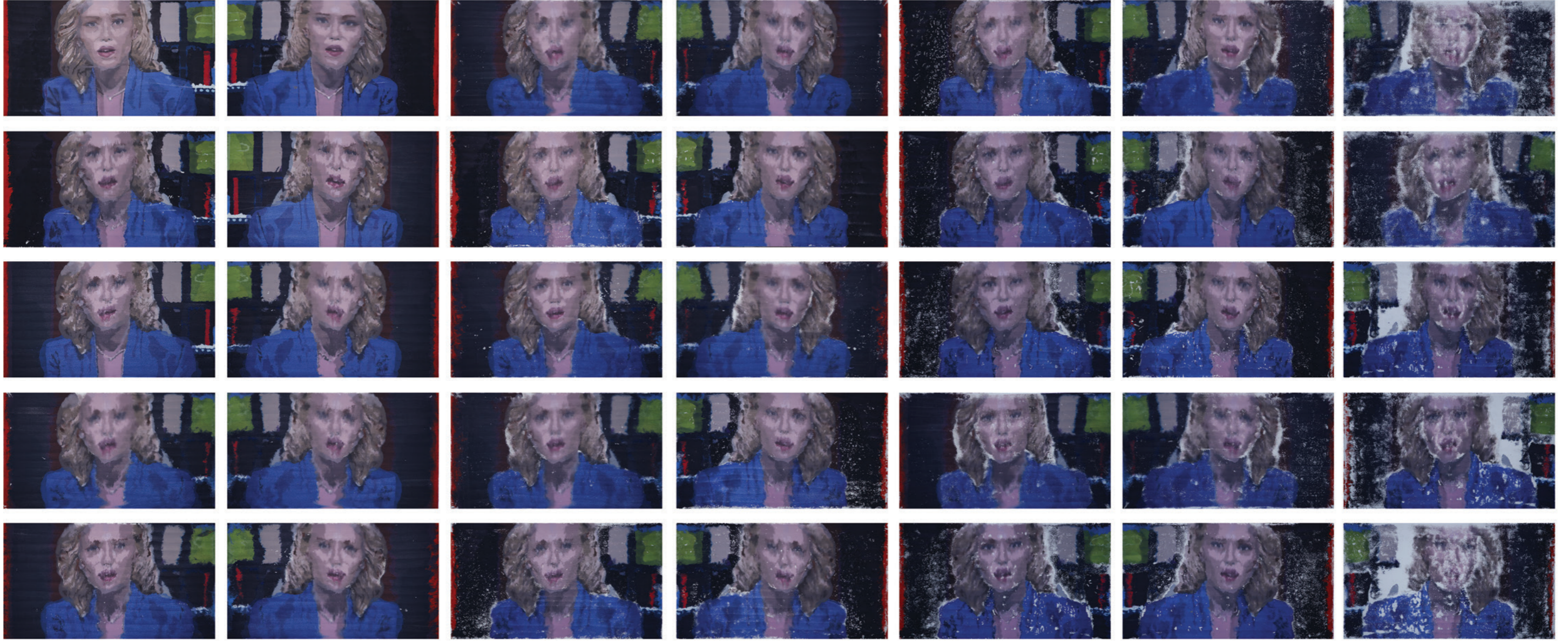
Metilfenidat (2017), Tuval üzerine yağlıboya / Oil on canvas, 35 parça/pieces, 50 x 90 cm (her biri/each)