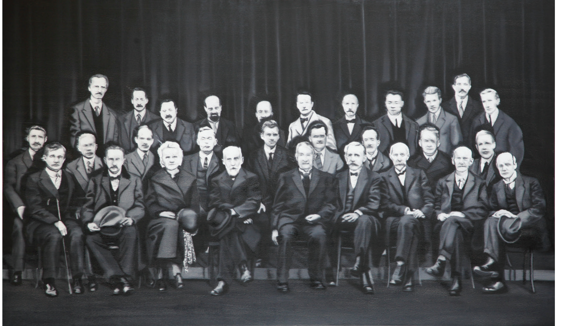
Imovane (2017), Tuval üzerine yağlıboya / Oil on canvas, 120 x 200 cm